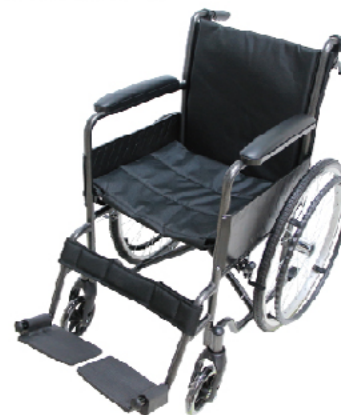
衛部醫器陸輸壹字第002588號 衛部器廣字第10505021號