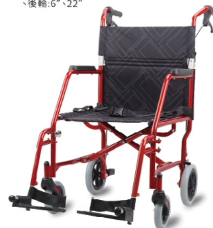
衛部醫器陸輸壹字第002588號 衛部器廣字第10505021號

材質:輕量化鋁合金骨架 規格:長×寬×高:100×64×89cm/座寬:46cm/前輪、後輪:6"、22"