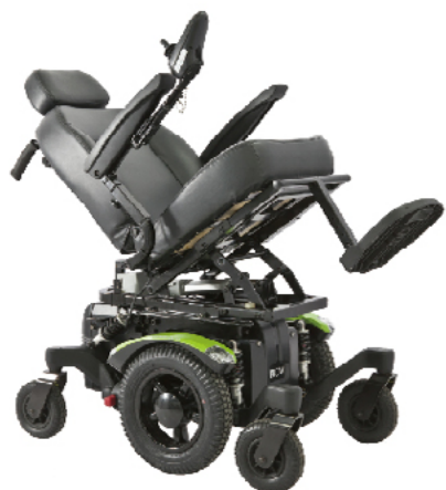
衛署醫器製字第002431號 衛部器廣字第10508009號