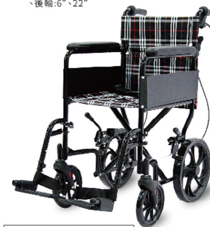
衛部醫器陸輸壹字第002588號 衛部器廣字第10505021號

材質:輕量化鋁合金骨架 規格:長×寬×高:100×54×92cm/座寬:PH-163A(42cm)、PH-183A(46cm)/前輪、後輪:6"、8"