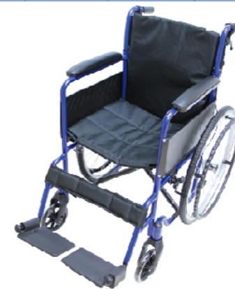
衛部醫器陸輸壹字第002588號 衛部器廣字第10505021號

材質:輕量化鋁合金骨架 規格:長×寬×高:100×64×89cm/座寬:46cm/前輪、後輪:6"、22"