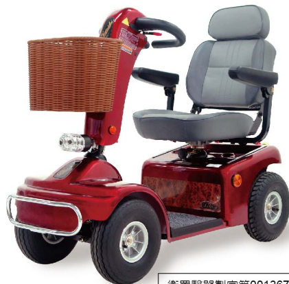
衛署醫器製字第001367號 衛部器廣字第10907004號