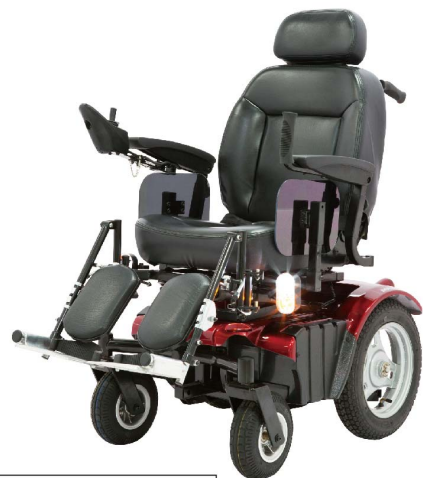
衛署醫器製字第001376號 衛部器廣字第10907003號