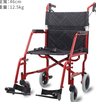
衛署醫器陸輸壹字第002588號 衛部器廣字第10901015號