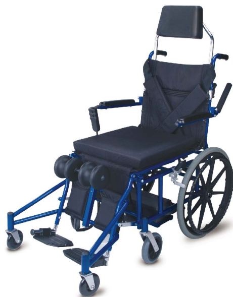
衛署醫器陸輸壹字第001472號 衛部器廣字第10806002號