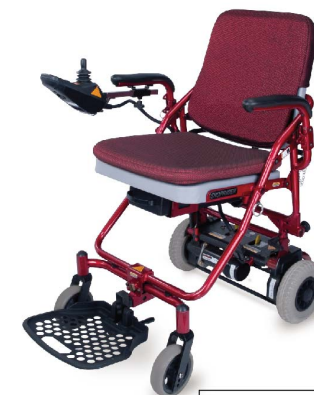
衛署醫器製字第002431號 衛部器廣字第10907003號