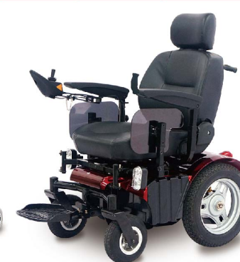
衛署醫器製字第001376號 衛部器廣字第10907003號

獨特之六輪獨立懸吊機構，配合高效率之4極馬達，即使在戶外使用，仍然輕鬆行進自如，為喜歡戶外活動使用者的最佳選擇。