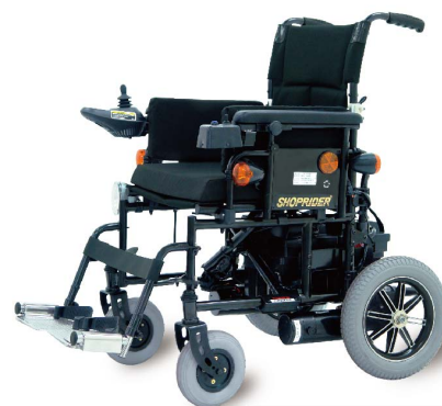
衛署醫器製字第001376號 衛部器廣字第10907003號