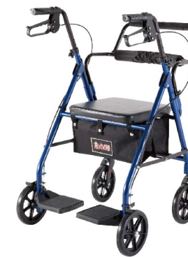
衛部醫器陸輸壹字第002784號 衛部器廣字第10806003號

YK7080鋁合金輪椅助行車 商品材質:鋁合金車架、PU輪胎、泡棉坐墊 商品尺寸:69x59x91-100cm 座墊尺寸:34x55cm 輪子尺寸:前輪8吋、後輪8吋 商品重量:9kg 產品載重:100kg