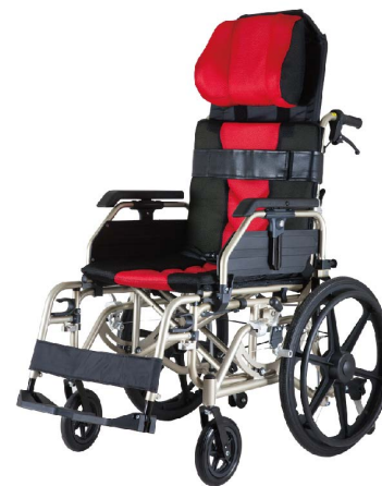
衛部醫器陸輸壹字第002588號 衛部器廣字第10806003號

※ 附加功能A款-可拆掀式扶手及可拆卸式腳靠以利於移位；附加功能C款-具及椅背連動之無段式座面空中傾倒功能，及配備胸帶及防傾輪