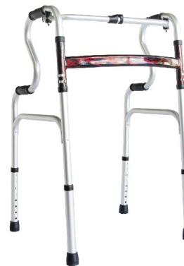
衛部醫器陸輸壹字第002784號 衛部器廣字第10901015號

YK7410 R型助行器 可承受重量:100kg 材質:鋁合金骨架、鐵製支撐桿 重量:2kg 尺寸:45x52x74~93cm(腳管伸縮:74-92cm)