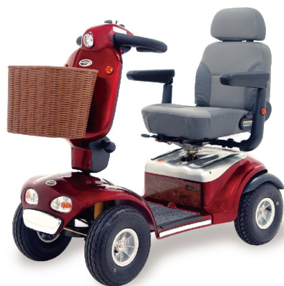
衛署醫器製字第001367號 衛部器廣字第10907004號

電動代步車的經典之作，配備大燈、前後方向燈，安全第一；座椅可左右90°旋轉，方便上下車。