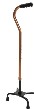
衛部醫器陸輸壹字第002786號 衛部器廣字第10901016號

YK7454單色折疊拐杖 可承受重量:100kg 材質:鋁合金 尺寸:高度:74-86cm/底座直徑:9cm