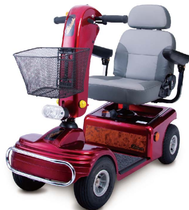
衛署醫器製字第001367號 衛部器廣字第10907004號