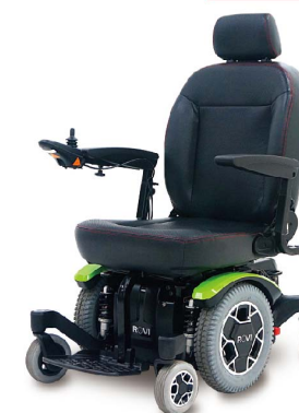
衛署醫器製字第002431號 衛部器廣字第10907003號