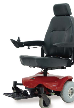
衛署醫器製字第001520號 衛部器廣字第10907003號