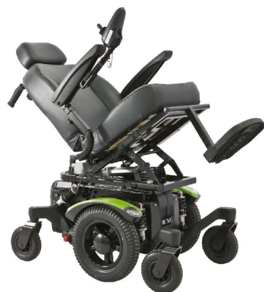
衛署醫器製字第002431號 衛部器廣字第10907003號