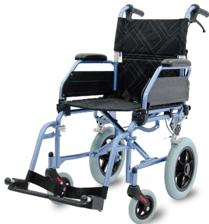
衛部醫器陸輸壹字第002588號 衛部器廣字第10806002號

PH-163B、PH-183B移位看護型輪椅 材質：輕量化鋁合金骨架 規格：長×寬×高：100×52×93cm/座寬：42cm/前輪、後輪：6"、12"