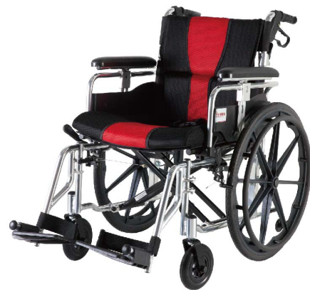
衛部醫器陸輸壹字第003353號 衛部器廣字第10901016號

PH-183KB移位輪椅 尺寸：105X65X86cm 座寬：47cm 重量：15.5kg 材質：鋁合金