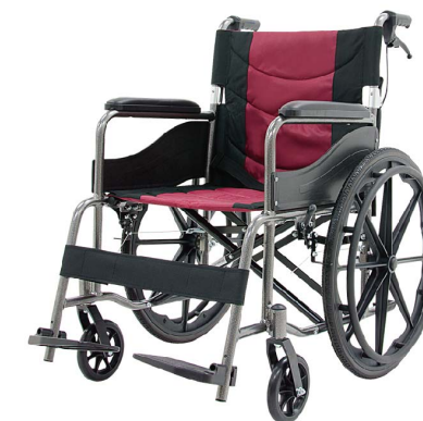
衛署醫器陸輸壹字第002785號 衛部器廣字第10907003號