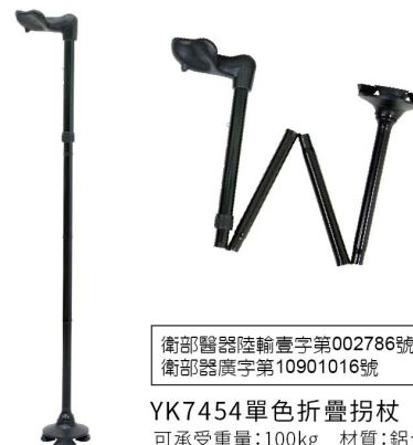
衛部醫器陸輸壹字第002786號 衛部器廣字第10901016號

YK7454單色折疊拐杖 可承受重量:100kg 材質:鋁合金 尺寸:高度:74-86cm/底座直徑:9cm