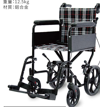
衛署醫器陸輸壹字第002588號 衛部器廣字第10806002號

材質:輕量化鋁合金骨架 規格:長×寬×高:100×54×92cm/座寬:PH-163A(42cm)、PH-183A(46cm)/前輪、後輪:6"、8"