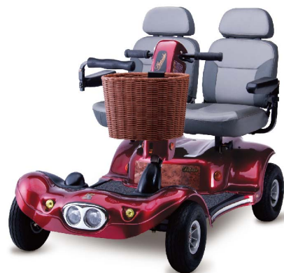
衛署醫器製字第001561號 衛部器廣字第10907005號

專利頭燈設計，應昇來車辨識度，增添行車安全。獨立四輪避震，同級車中最省電，亦可更換大容量電瓶。