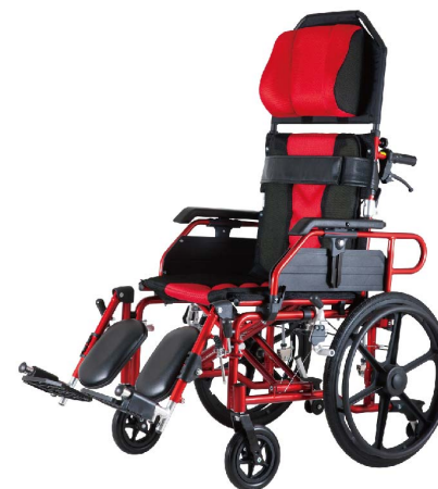
衛部醫器陸輸壹字第002588號 衛部器廣字第10901015號

※ 附加功能A款-可拆掀式扶手及可拆卸式腳靠以利於移位；附加功能B款-具不及座面運動之椅背仰躺功能(無段式調整)，且具備胸帶及防傾輪