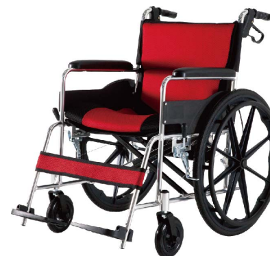
衛署醫器陸輸壹字第003353號 衛部器廣字第10901016號